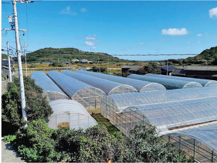
図2. シロマダラ発見場所の周辺環境（2021年11月7日）