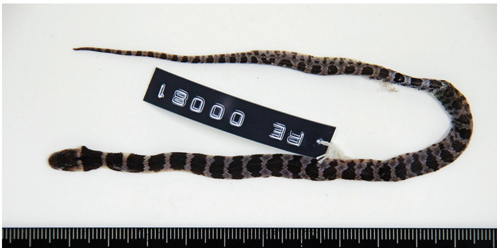
図4. シロマダラの標本（2023年2月10日）