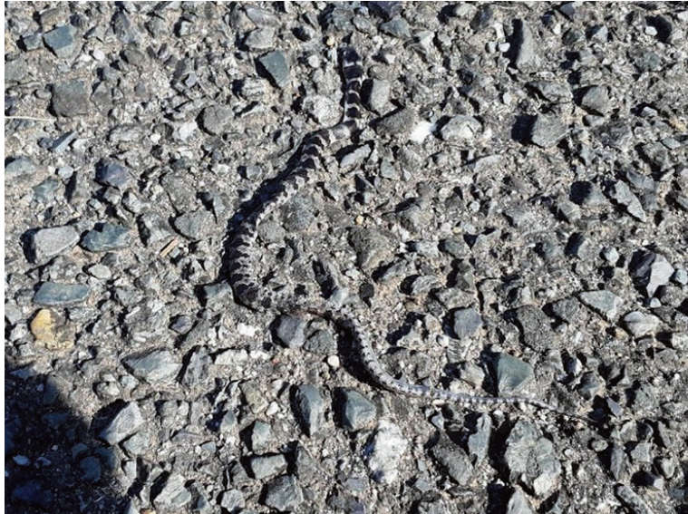
図3. 発見場所におけるシロマダラ死体の状況（2021年11月7日）